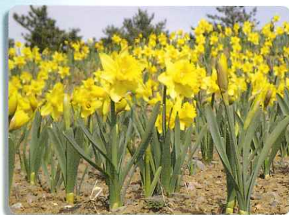
海浜公園のスイセン