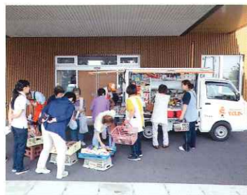
移動販売車の来苑