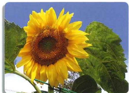
那珂湊第三小学校のひまわり