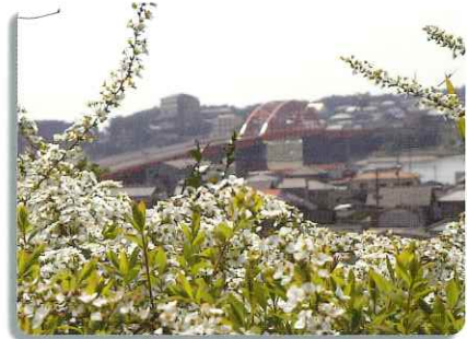
湊公園から見た海門橋