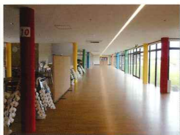
ウォーキングスペース