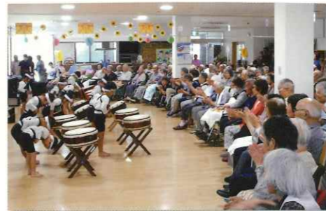
保育園児太鼓演奏会

常時介護が必要な方で、在宅での介護が困難な方を長期間にわたって、専門スタッフのサポートを受けながら、生活していく施設です。嘱託医が週2回、回診を行っており、突然のケガや病気にも対応できる体制を整えています。ご利用者様一人一人に応じた個別ケアの提供を目指し、日々、質の向上に努めています。