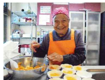
食事作りのお手伝い