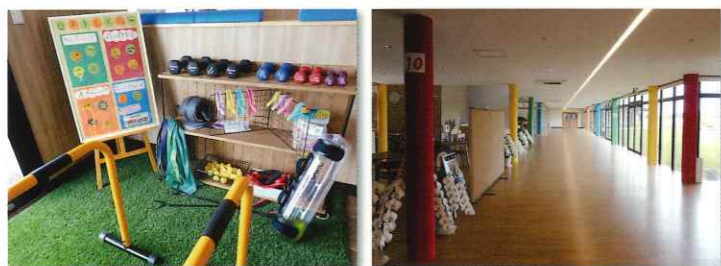
自主トレスペース