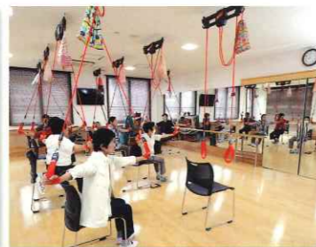
レッドコードのリハビリ