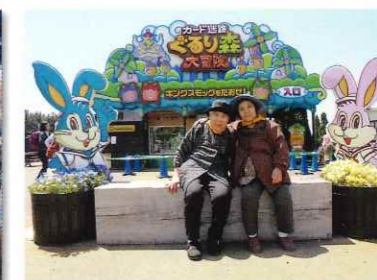
春の遠足(ひたちなか海浜公園)