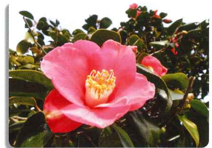
酒列磯前神社の椿