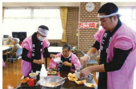
美味しいおやつ作り