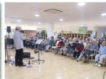
ボランティア演奏会