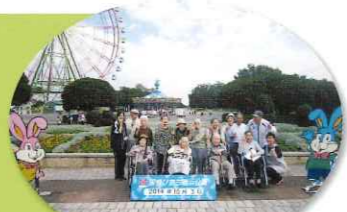
ひたちなか海浜公園