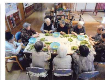
園芸療法(そら豆の収穫)